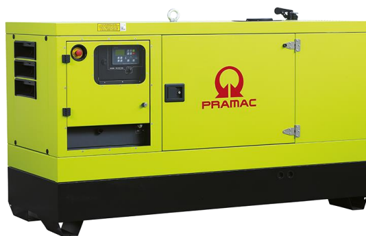
Imagen utilizada solo con fines ilustrativos